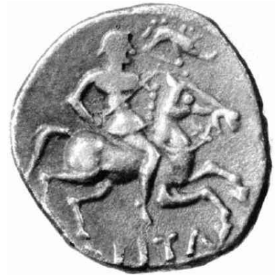
Revers d'une pièce de monnaie des Eduens (1er siècle av J.-C.) Un cavalier gaulois porte une enseigne au sanglier