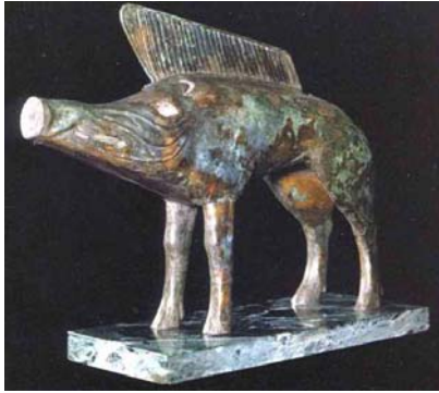
Sanglier hérissé sculpté